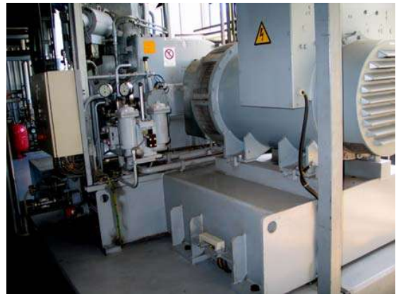
Attēlos: REA organizētais Daugavgrīvas koģenerācijas stacijas, kas darbojas ar šķeldu, apmeklējums kopā ar Rumānijas valsts delegāciju

REA 2008.gadā veica arī viena pašvaldības projekta izpildi – „Mājokļu energoauditi 2008”. (PVS ID 1061-2525). Projekta finansējums Ls 10 000 apjomā tika iedalīts no Pilsētas attīstības fonda. Projekta ietvaros REA organizēja 21 dzīvojamās mājas energoauditu. Energoauditu rezultāti un to analīze apkopota REA sagatavotajā elektroniskajā brošūrā „Mājokļu energoauditi 2008”, kas ievietota REA interneta vietnē www.rea.riga.lv sadaļā „Energoefektivitāte. Brošūras”. Darba nodrošinājumam izlietoti Ls 2 846,14. Atlikušie līdzekļi - Ls 7 153,86 apjomā identiskam mērķim tiks izlietoti 2009.gadā. REA savai darbībai par šī projekta izpildi nekādu kompensāciju nav saņēmusi.