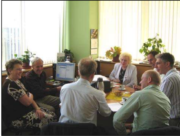
Attēlā : Firmu pārstāvju grupa, kas veido ESCO piedāvājumu māju siltināšanai, sarunās ar REA aģentūras telpās