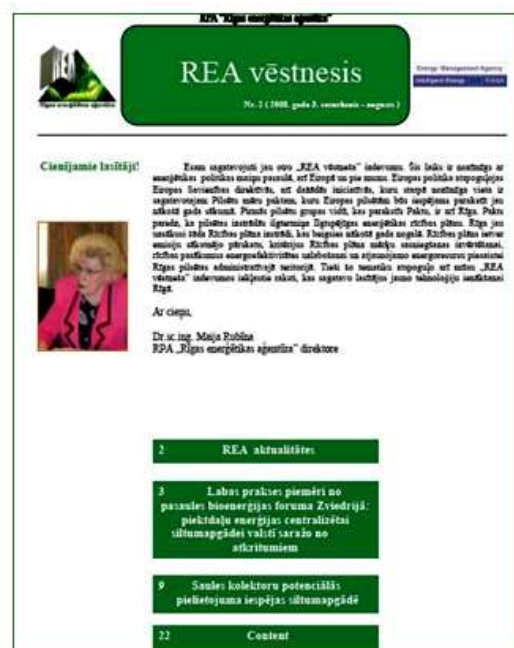
Attēlā: Pirmo divu elektronisko žurnālu „REA vēstnesis” titullapu attēls

Žurnālā tiek ievietoti raksti par jaunākajām tehnoloģijām, materiāliem un pētījumiem un pieredzi energoapgādes, energoefektivitātes un atjaunojamo energoresursu jomā. Raksti top sadarbībā ar servisa firmām un citiem sadarbības partneriem, kā arī atspoguļo jaunāko informāciju, kas iegūta starptautiskos semināros un komandējumos. Neliels žurnālu eksemplāru skaits (līdz 20) tiek pavairots, brošēts un izdalīts arī papīra formātā.