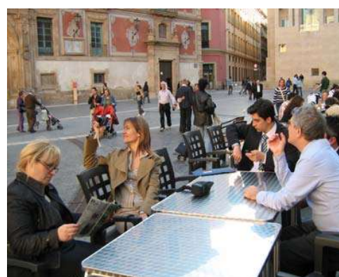
Attēlos: Sanāksmes telpās. Modernu notekūdeņu attīrīšanas iekārtu ar biogāzes izstrādi apmeklējums. Atpūtas brīdī Mursijā