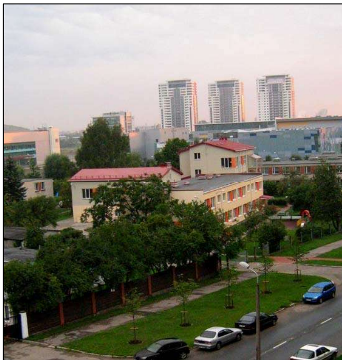
Attēlā: Siltinātais pašvaldības bērnu dārziņa komplekss ar baseina izbūvi Vešetas ielā

Pildot energoapgādes un energoefektivitātes vadības un koordinācijas funkcijas, REA 2008.gadā bez jau iepriekš minētā ir veikusi arī sekojošo: