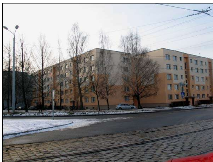
Attēlā: Siltinātās mājas Kurzemes prospektā 14 (no kreisās) un Bebru ielā 4 (2008.g.)