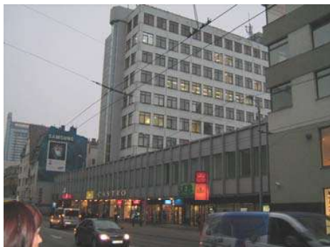
Attēlā: Nams Brīvības ielā 49/53

Atbilstoši starptautiskā projekta nostādņēm un Eiropas pašvaldību enerģētikas aģentūru praksei, REA darbinieku sastāvs paredzēts mazskaitlīgs. Atbilstoši prasībām, divi no darbiniekiem ir ar lielu darba pieredzi analogā jomā, kas ir priekšnoteikums aģentūras veiksmīgai darbībai. Palīgpakalpojumi, kā grāmatvedības un ekonomista pakalpojumi, iepirkuma procedūru nodrošināšana, saimnieciskie un sabiedrisko attiecību, kā arī konsultāciju un tulkošanas pakalpojumi ir ārpakalpojumi, kas tiek veikti uz attiecīgu līgumu pamata.