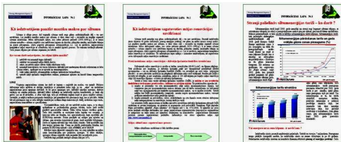
Attēlā: REA informācijas lapu titullapu attēli.

• Nr.1 „ Kā iedzīvotājiem panākt mazāku maksu par siltumu ”. Lapā doti praktiski padomi, kā iedzīvotājiem rīkoties savu rēķinu samazināšanas interesēs jau līdz dzīvojamo māju siltināšanai, tostarp blīvējot vai mainot logus, uzstādot termoregulatorus pie radiatoriem, uzturot optimālu temperatūras režīmu ar temperatūras pazemināšanu naktī utt.