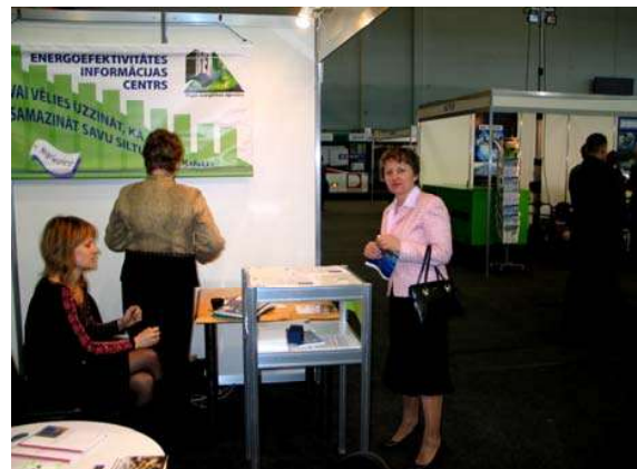
Attēlos: REA stends izstādē „ENERGOEFEKTIVITĀTE 2008”

• 27.-29.11.2008. – ikgadējā starptautiskā izstādē „Vide un Enerģija 2008” izstāžu kompleksā Ķīpsalā.