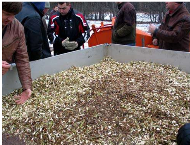
Attēlos: Enerģētisko ātraudzīgo kārkļu novākšanas izbraukuma seminārā Olainē 06.03.2008.

Piedalīšanās semināros nodrošina REA darbiniekiem augstu informētības un profesionālo līmeni.