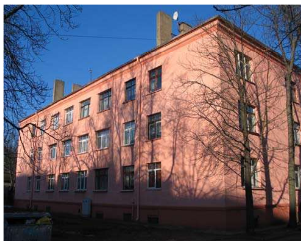
Attēlā: dzīvojamā ēka Ieriķu ielā 44, kas krāsota ar TSM Ceramic atstarojošo krāsu (2008.g.)