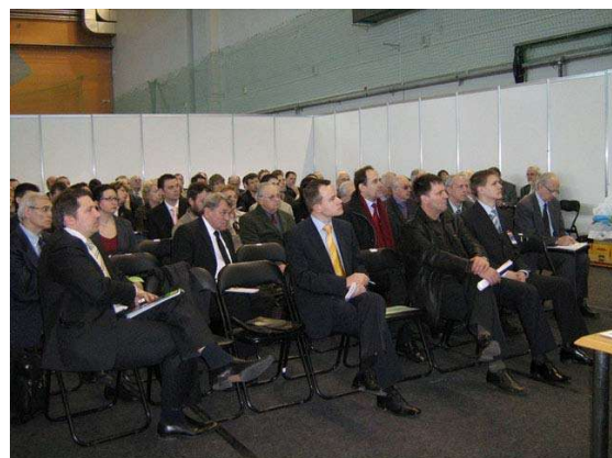
Attēlos: Seminārs izstādē „ENERGOEFEKTIVITĀTE 2008”