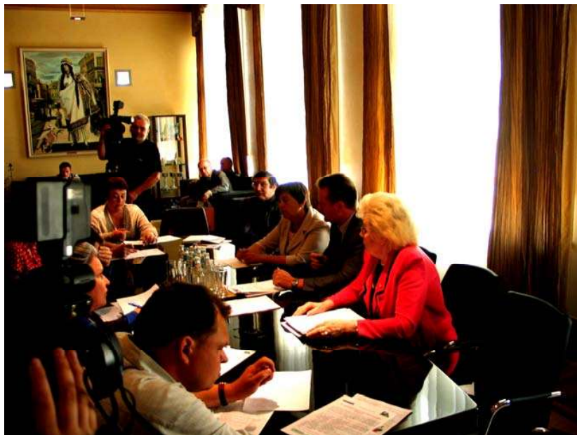
Attēlā: Preses konference Rīgas domē saistībā ar māju atlasē energoauditu veikšanai konkursa izsludināšanu

REA 2008.gadā veica arī viena pašvaldības projekta izpildi – „Mājokļu energoauditi 2008”. (PVS ID 1061-2525). Projekta finansējums Ls 10 000 apjomā tika iedalīts no Pilsētas attīstības fonda. Projekta ietvaros REA organizēja 21 dzīvojamās mājas energoauditu. Energoauditu rezultāti un to analīze apkopota REA sagatavotajā elektroniskajā brošūrā „Mājokļu energoauditi 2008”, kas ievietota REA interneta vietnē www.rea.riga.lv sadaļā „Energoefektivitāte. Brošūras”. Darba nodrošinājumam izlietoti Ls 2 846,14. Atlikušie līdzekļi - Ls 7 153,86 apjomā identiskam mērķim tiks izlietoti 2009.gadā. REA savai darbībai par šī projekta izpildi nekādu kompensāciju nav saņēmusi.