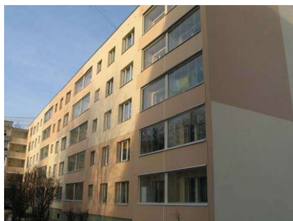
Attēlā: Siltināta dzīvojamā ēka Kurzemes prospektā 4 (2008.g.)