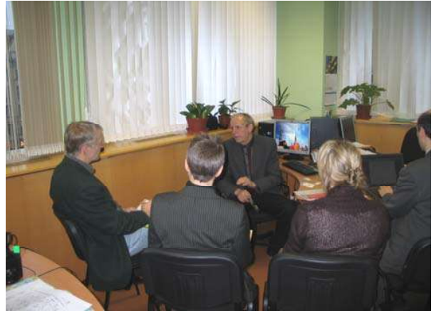
Attēlā: REA telpās viesojas vācu firma „Auraplan” no Hamburgas (Vācija) ar pieredzi energoefektīvo un pasīvo māju būvniecībā

Savu mājas lapu ar adresi www.rea.riga.lv REA izveidoja 2008.gada sākumā. Mājas lapa tiek uzturēta latviešu un angļu valodā un latviešu valodā tiek veidota ar šādām sadaļām: