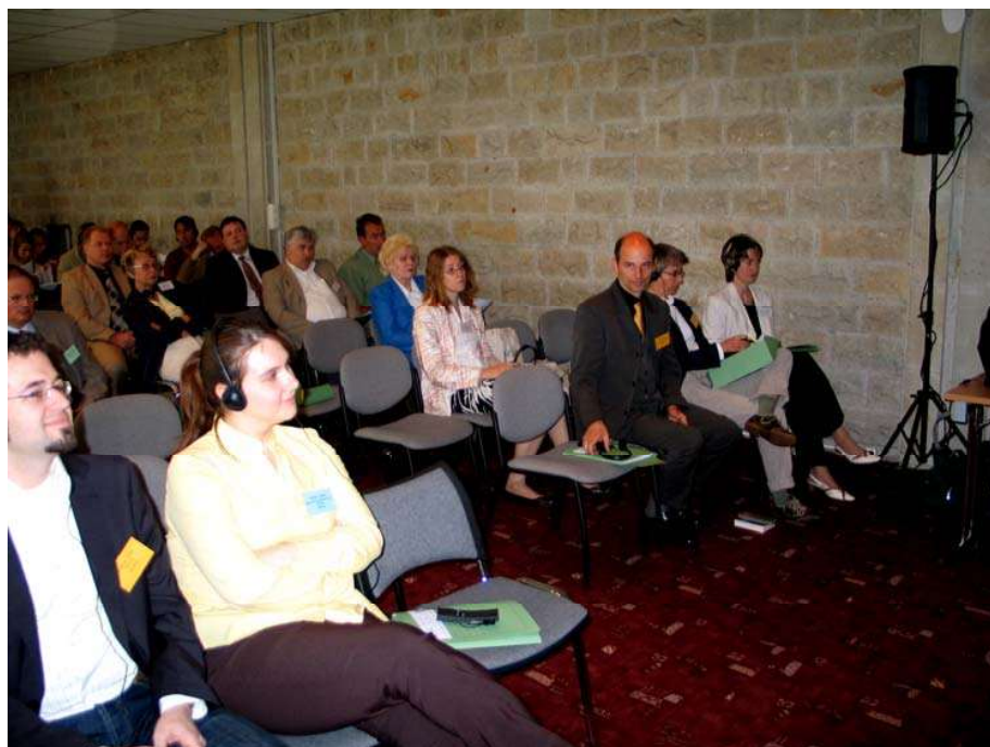
Attēlā: BEF organizētajā ar Norvēģijas projektu saistītajā seminārā Jūrmalā 11.06.2008.

3) Projektu „Stratēģiskas koncepcijas izstrāde inovatīvas un energoefektīvas būvprakses ieviešanai Baltijas valstīs”(PVS ID 2481). Projekta vadītājs – BEF. Finansētājs – Vācijas Vides aizsardzības fonds. Rīgas domes līdzfinansējums nebija nepieciešams. REA projekta ietvaros sagatavoja un tipogrāfiski tika izdota brošūra „Ēku energoefektivitātes paaugstināšana. Eiropas Savienības politika un labas prakses piemēri pašvaldībās”, kas tiek izplatīta. Nodrošināti REA darbinieku vietējie un ārvalstu komandējumi. Projekts pabeigts.